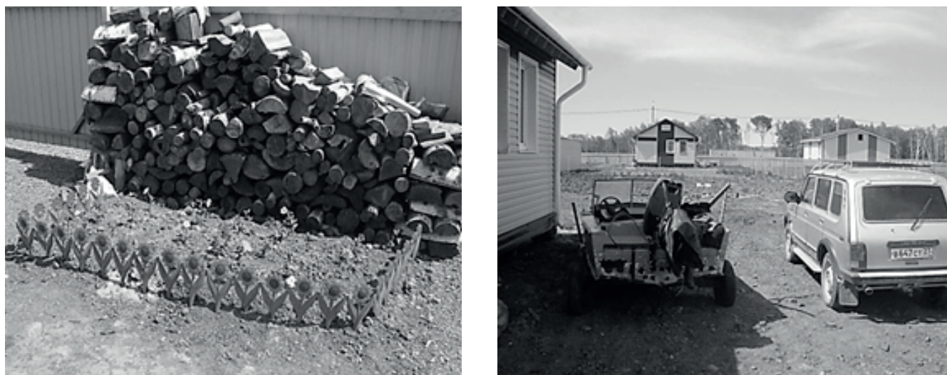
Рис. 3. Индивидуальная усадьба с. Бельго (июль 2015 г.)