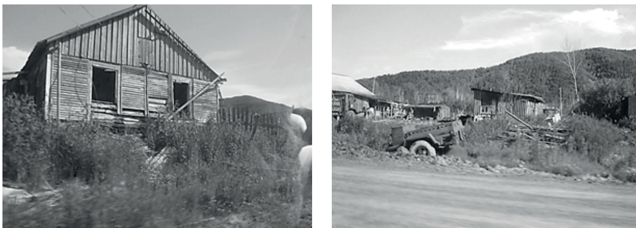
Рис. 4. Фрагменты прежнего с. Бельго (июль 2015 г.)

По вопросу развития этнотуризма требовалось изучить мнение специалистов, поэтому был произведён опрос экспертов в области туристских услуг. У них на этот счёт имеется другая точка зрения. Эксперты считают, что развитию этнотуризма в Хабаровском крае мешает отсутствие развитой инфраструктуры, связанной с трансфером, питанием, проживанием, развлечением туристов, рекламой туристских услуг; низкий уровень информационного и кадрового обеспечения. В отношении въездного туризма отмечается нехватка квалифицированных переводчиков. Тем не менее эксперты признают необходимость в создании новых этнографических центров, а также то, что этническая культура представляет интерес как для иностранцев, так и для жителей других регионов России.