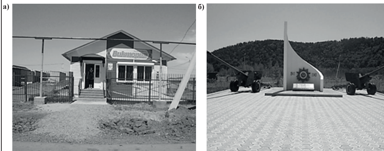
Рис. 2. Топографический (а) и официальный (б) центры национального села Бельго (июль 2015 г.)