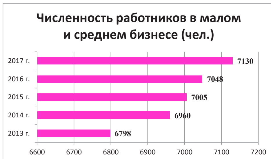
Рис. 3. Численность работников в малом и среднем бизнесе в период с 2013 по 2017 год

Численность работников в малом и среднем бизнесе имеет положительную тенденцию. Ежегодно наблюдается увеличение количества трудоспособного населения (см. рис. 3).