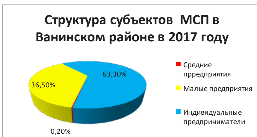
Рис. 1. Структура субъектов МСП

На рис. 1 и 2 представлена структура субъектов малого бизнеса и их количество.