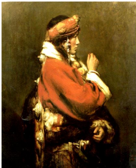
Рис. 2. Тибетская женщина на празднике (фестивале) «Гань- нань» (节日中的甘南藏女) 115×100 см, 2004 год