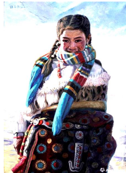
Рис. 3. Цветы Гезана (格桑花) 150×100 см, 2015 год (холст, масло)