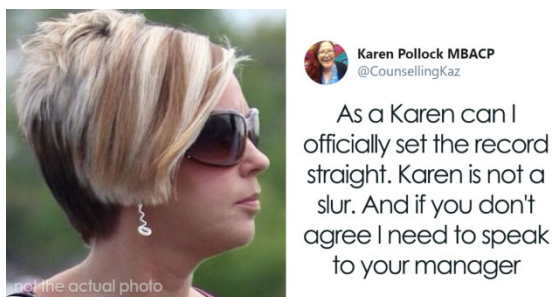
Рис. 1. Пост в социальной сети

Благодаря данному мему имя Карен стало нарицательным и используется в качестве существительного. Теперь Карен – это не просто женщина с таким именем, а отрицательный и комичный персонаж. В приведённых ниже примерах на рис. 1 и 2 мы видим, что имя Карен подчиняется правилам имени существительного в английском языке: во фразах «As a Karen...», «...a Karen told me...» используется артикль «a» в значении «одна из», «какая-то», что можно считать уничижительным обращением к персонажу.