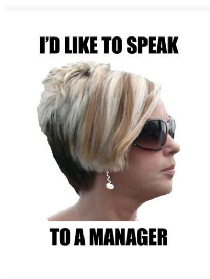
Рис. 3. Пример реализации мема «Карен»

Пассивная агрессия, или фальшивая вежливость, является ещё одной чертой, присущей данному персонажу. В примере на рис. 4 изображена записка, которая была вложена в почтовый ящик семьи девочки, которая, являясь членом движения «герл-скаут», продаёт печенье. Надпись на рисунке гласит: «Dear Girl Scout and mom, a thank you note or drawing is always appreciated on an order. Let this be your inspiration», что в переводе означает: «Дорогие Девочка-Скаут и [её] мама, благодарственная записка или рисунок всегда приятно дополняют заказ. Пусть это будет вашим вдохновением». В записке была использована вежливая форма обращения «Dear Girl Scout and mom», а также грамматическая конструкция пассивного залога «is always appreciated», что можно считать индикаторами формального стиля письма, не свойственным для такого рода обращений, что может указывать на факт пассивной агрессии.