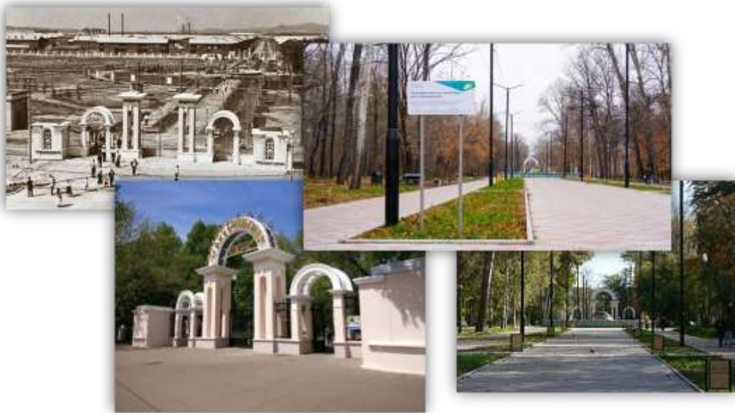
Рис. 2. Парк «Судостроитель»

Сквер на площади Юности (ЗЛК) также представляет собой объект насаждений общего пользования нашего города (см. рис. 3). Это такой озеленённый островок, который так необходим нашим улицам и площадям и который можно использовать для кратковременного отдыха и архитектурно-декоративных целей озеленения. Площадь также вошла в федеральную программу «Комфортная городская среда», и после её реконструкции в сквере появились не только клумбы, но и два фонтана. Площадь стала излюбленным местом отдыха [6; 7].