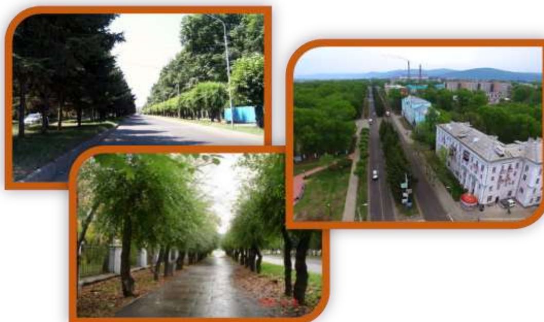
Рис. 7. Зелёное убранство улицы Аллея Труда

Буферные зоны или территории придомовых земельных участков в основном не благоустроены с точки зрения зелёного строительства со стороны улицы. Ландшафтный облик дворовых территорий безлик и неинтересен, поэтому мало отвечает экологическим и эстетическим требованиям [6; 7].