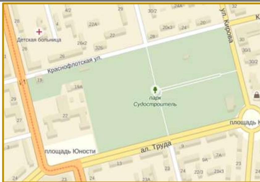
Рис. 1. Парк «Судостроитель» на карте города

Зелёные насаждения на территории парка, площади, сквера и прилегающих улиц относятся к зелёным насаждениям категории общего пользования.