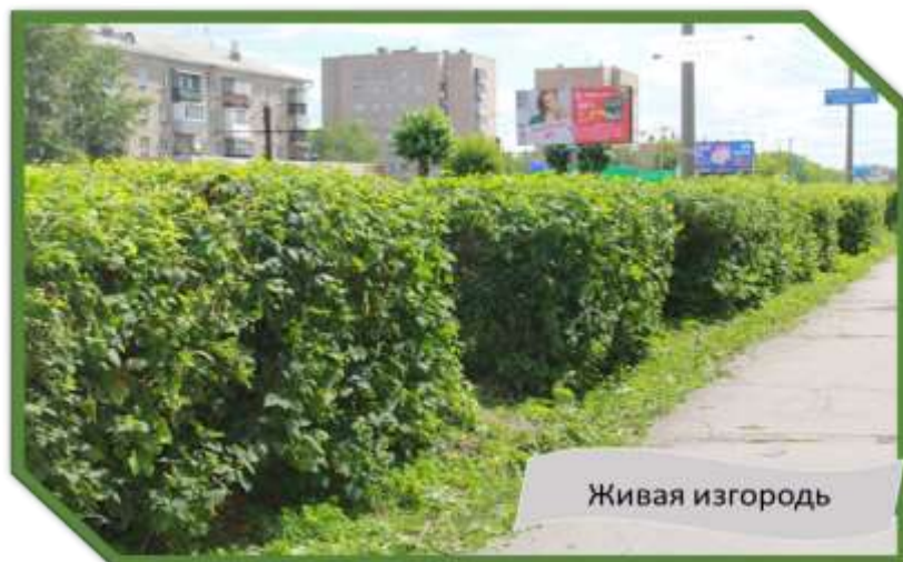
Рис. 8. Пример живой изгороди

Заключение. На основании проведённого анализа видов и состояния зелёных насаждений города Юности можно сделать вывод, что в нашем городе зелёное строительство в основном осуществляется в форме высадки деревьев. Декоративные кустарники в озеленении города Комсомольска-на-Амуре используются, но в небольшом количестве [8]. Озеленение городских улиц и скверов в виде живых изгородей из кустарников пузыреплодника, рябинника является эффективным как с точки зрения защитных функций, так и декоративно-архитектурных решений в зелёном обустройстве города (см. рис. 8).