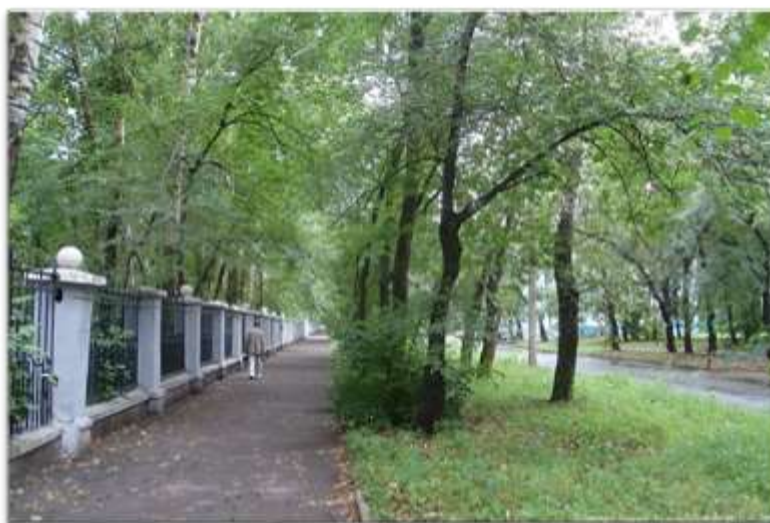
Рис. 5. Улица Краснофлотская

В 1970-х гг. начался снос деревянных двухэтажек 1930-х годов постройки, и исторический центр города был застроен панельными и кирпичными высотками. Насаждения на улице можно назвать аллейнными с рядовыми и групповыми посадками деревьев (см. рис. 5).